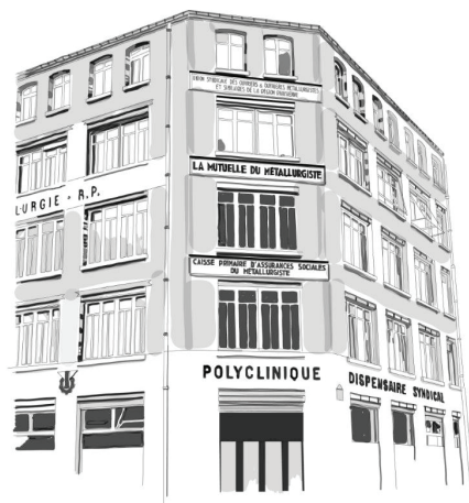
Le 9 rue des Bluets à Paris

Le 4 février 1937, un ancien entrepôt de machine-outil est ainsi acquis au 9 rue des Bluets à Paris (XI e arr.). Des travaux sont réalisés avant son inauguration le 5 novembre 1938 . L'hôpital propose des consultations médicales gratuites, une antenne chirurgicale, un cabinet dentaire et un centre médical pour les enfants.