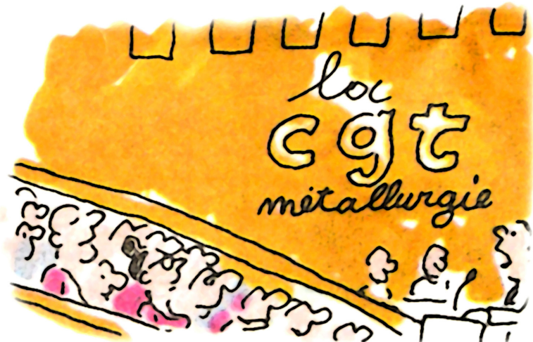
dessin réalisé par Georges Wolinski à l'occasion du 40e Congrès, publié dans Charlie Hebdo n°1148, du 18 juin 2014

Pour construire notre document d'orientation, nous avons rapidement besoin de favoriser les échanges et l'implication de tous les syndiqués. Mettre la démocratie et les syndiqués au centre de notre démarche pour la construction du congrès et l'élaboration des documents, cela s'appelle « innover » !