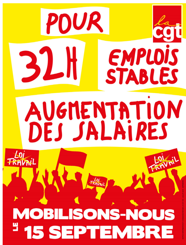
© Affiche confédérale appelant à la manifestation - Boréal

Le plus récent est celui du contrat première embauche (CPE), retiré le 10 avril 2006, soit deux mois après son adoption par le Parlement. Le gouvernement de Villepin, dû reculer face à l'ampleur des mobilisations des jeunes et des travailleurs : quatre journées totalisèrent ainsi plus d'un million de personnes dans les rues, alors que les occupations des lieux d'études et les actions coup de poings ne faiblissaient pas.