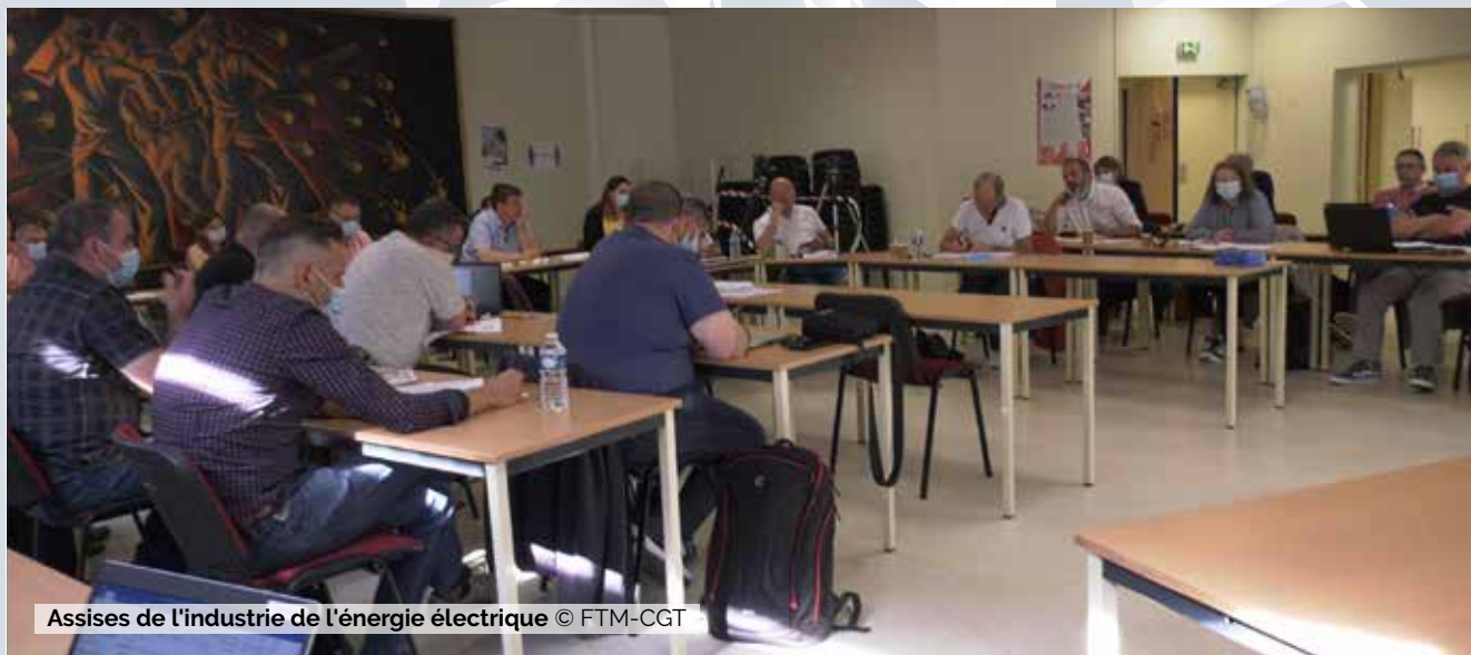
Assises de l'industrie de l'énergie électrique

Nous sommes effectivement tous confrontés aux mêmes stratégies mais la situation n'est pas la même d'une entreprise à une autre. Nous avons besoin de développer des projets alternatifs car nos salariés ne voient pas de perspectives. Il faut créer une nouvelle dynamique de reconquête, au risque