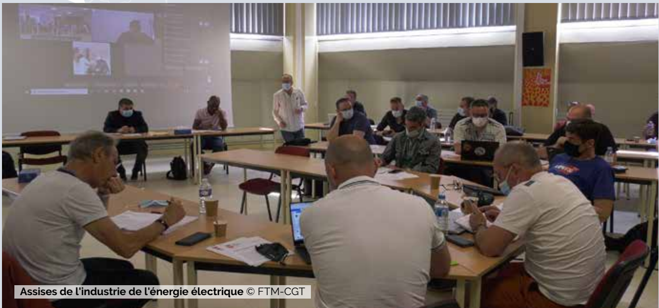
Assises de l'industrie de l'énergie électrique

La vente de GE Steam Power interviendra d'ici la fin de l'année. Cette bataille, nous devons la mener tous ensemble parce que le devenir de cette entreprise est emblématique d'une certaine logique. Nous avons donc intérêt à faire de nos combats des combats communs, qui portent les mêmes logiques. Et nous avons des points d'appui importants, pour peu que nos collègues prennent conscience que leur outil est bradé. Ils veulent le