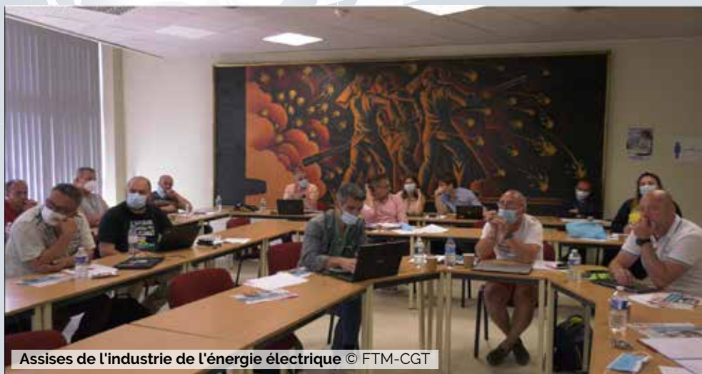
Assises de l'industrie de l'énergie électrique

Le devenir de la filière passe par les mobilisations des salariés et une CGT qui apporte analyses et propositions. La convergence revendicative et l'action